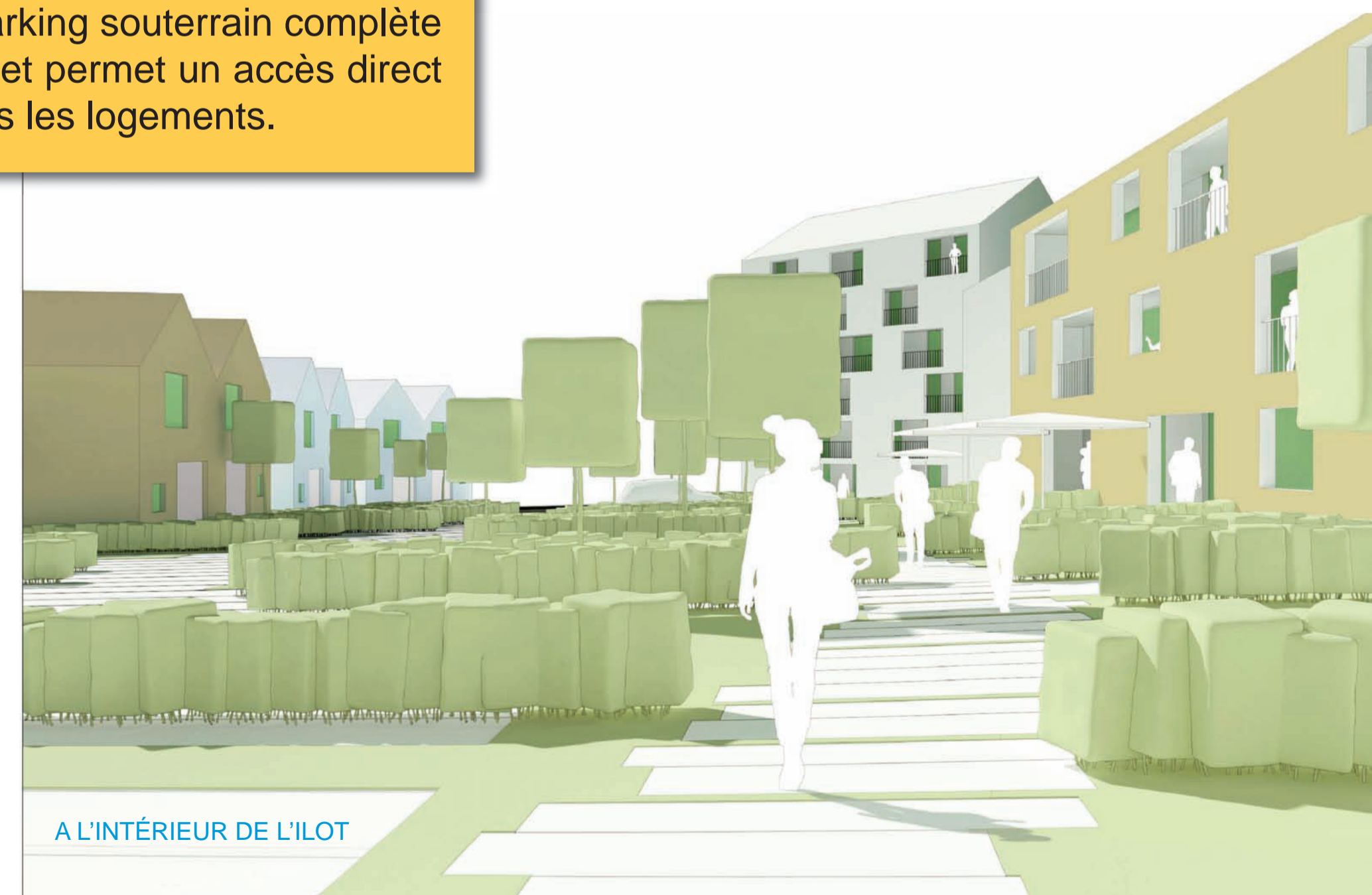
A L'INTÉRIEUR DE L'ÎLOT